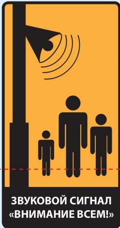
ЗВУКОВОЙ СИГНАЛ «ВНИМАНИЕ ВСЕМ!»

Оповещение населения – доведение до населения экстренной информации о возникающих опасностях, правилах безопасного поведения и порядке действий в различных ситуациях.